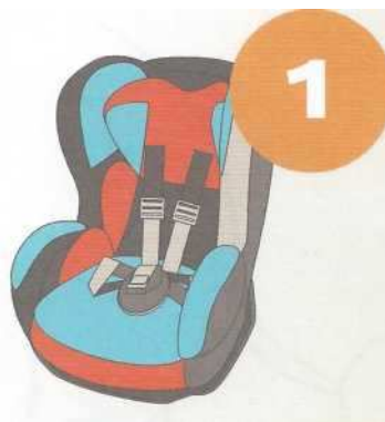
9-18 кг от 9 месяцев до 4 лет