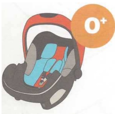
0-13 кг от рождения до 1 года

Покупайте кресло вместе с ребенком. Пусть он попробует посидеть в нем - прямо в магазине.