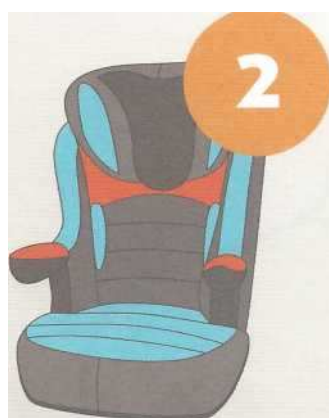
15-25 кг от 3 до 7 лет