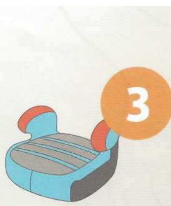
22-36 кг от 6 до 12 лет